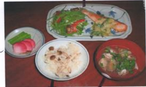
A 鮭のネギみそソースかけ